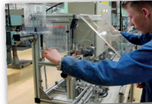
Bac pro MSPC