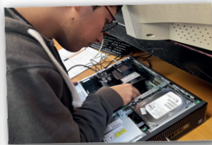
Bac pro SN