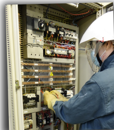
Bac pro MELEC