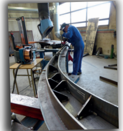
Bac pro TCI

b) Découverte des 4 sections de BAC PRO du lycée Louis Geisler à Raon l'Étape sur 6 demi-journées (Peinture, Maçonnerie, Logistique et Commerce).